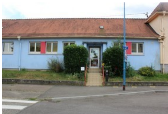
Entrée du centre de loisirs Les arbres fleuris

La ville de Reichstett accueille nos enfants en dehors des temps scolaires. L'accueil périscolaire et de loisirs « les Arbres Fleuris » accueille les enfants de maternelle et d'élémentaire. Les places sont limitées et prises d'assaut.